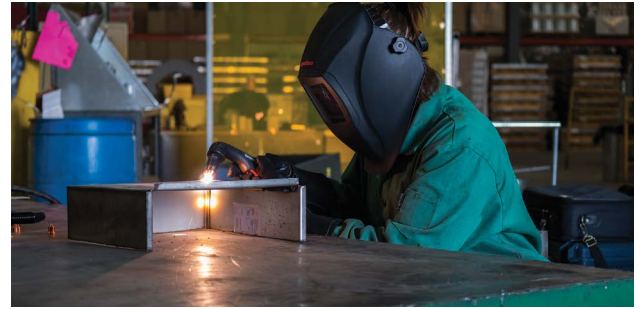
CVC et entrepreneuriat en installations mécaniques

Entretien de biens/d'usine, incendie et secours, fabrication générale et :