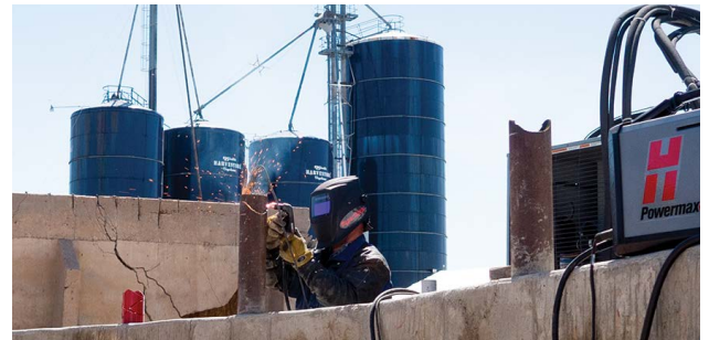
Entretien de machines agricoles